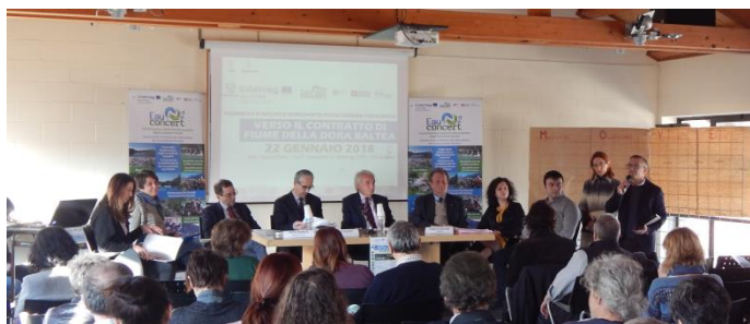
Fig. 1: presentazione della Cabina di Regia