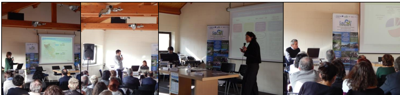
Fig. 2, 3, 4, e 5: gli interventi dei relatori

All’evento si è registrata la partecipazione complessiva di 70 soggetti . Di seguito sono riportate le percentuali per categoria di rappresentanza e la tabella con i nominativi delle amministrazioni locali, enti, consorzi, associazioni, imprese e professionisti che hanno presenziato all’assemblea di bacino e al workshop di progettazione.