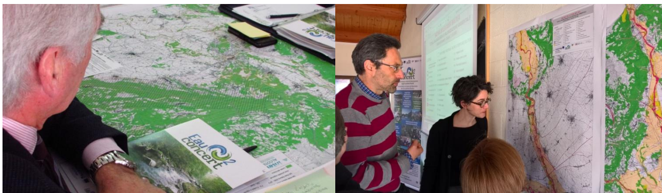
Fig. 6, 7 e 8: momenti dei tavoli di partecipazione

La suddivisione dei partecipanti al workshop, 43 in totale, è avvenuta secondo la preferenza di ogni soggetto,