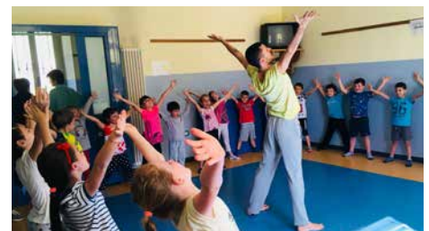
I laboratori teatrali e di danza