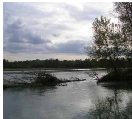
La Dora Baltea e la vegetazione ripariale (Ivrea - San Bernardo e confluenza con il Po) e momenti della progettazione partecipata

l'Ambiente), verranno realizzati interventi di miglioramento boschivo su 18 ettari di superficie, in un'ottica multifunzionale (mitigazione del rischio idraulico, tutela della biodiversità, conservazione del paesaggio) e di riconnessione di tratti della rete ecologica frammentata per un'estensione di 5 km. Saranno anche intraprese azioni per limitare la diffusione di alcune specie vegetali esotiche invasive.