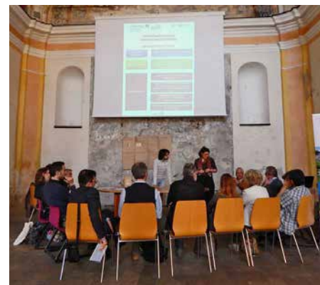
Progettazione partecipata del Contratto di Fiume della Dora Baltea

Ed è proprio partendo dal contributo degli enti locali e dei cittadini che durante i tavoli di partecipazione, le interviste strutturate con gli amministratori e gli incontri di sensibilizzazione con il mondo scolastico è stata avviata l'indagine per la redazione della Mappa di comunità sui luoghi culturali e naturalistici. Uno