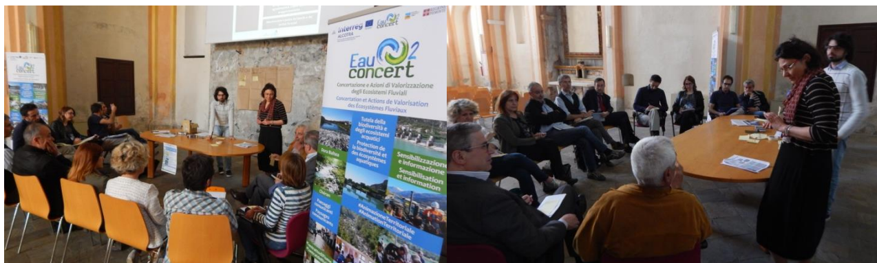
Fig. 5 e 6: Agricoltura sostenibile

Il perseguimento di tali obiettivi può avvenire mediante l’accesso a risorse finanziarie pubbliche (es. misure PSR e programmazione europea), il coinvolgimento di aziende agricole in iniziative pilota e la replicabilità di buone pratiche già sperimentate.