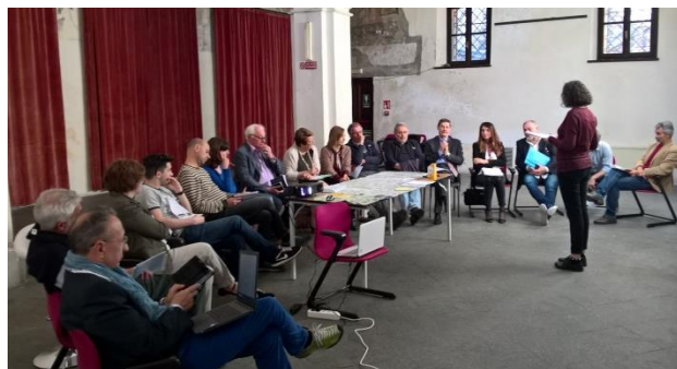
Fig. 4: Marketing territoriale

Partendo dagli elementi emersi durante i quattro tavoli di partecipazione di Bollengo del 22 gennaio 2018 ( Tutela, salvaguardia e valorizzazione del patrimonio ambientale del bacino della Dora Baltea; Fruibilità turistica del bacino della Dora Baltea: identità e promozione del territorio ) e di Crescentino del 26 marzo 2018 ( Gestione integrata dell'assetto fluviale; Reti ecologiche e Valorizzazione del patrimonio ambientale ), sono stati illustrati gli obiettivi generali, gli obiettivi specifici e gli argomenti prioritari di discussione: