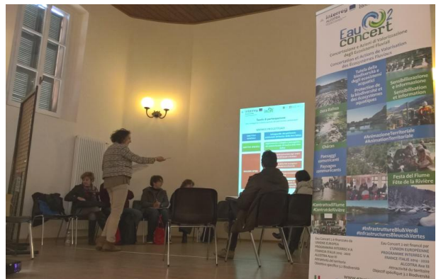
Fig. 3: "Reti ecologiche e valorizzazione del patrimonio ambientale"