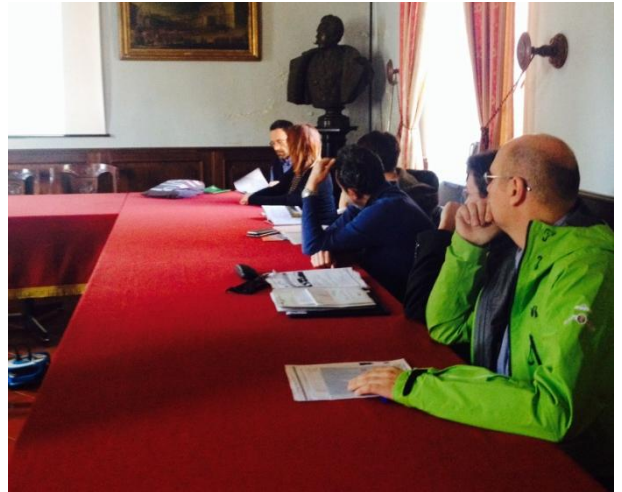
Fig. 2: "Gestione integrata dell'assetto fluviale"

In chiusura si segnala che il prossimo appuntamento per il territorio sarà quello del 19 aprile 2018 a Ivrea , in cui si darà l'avvio dei tavoli di lavoro dedicati al Marketing territoriale e all' Agricoltura sostenibile .